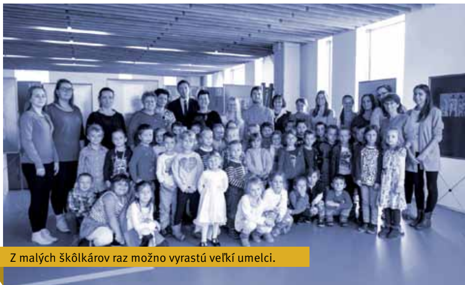
Z malých škôlkárov raz možno vyrastú veľkí umelci.