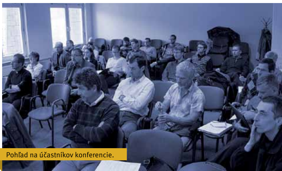
Pohľad na účastníkov konferencie.