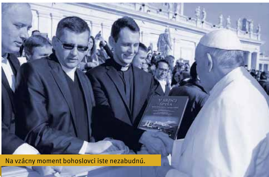
Na vzácny moment bohoslovci iste nezabudnú.

kupmi v Lateránskej bazilike a cestou naspäť si pozreli Benátky, kde ich srdečne prijali a pohostili vo farnosti Panny Márie Karmelskej.