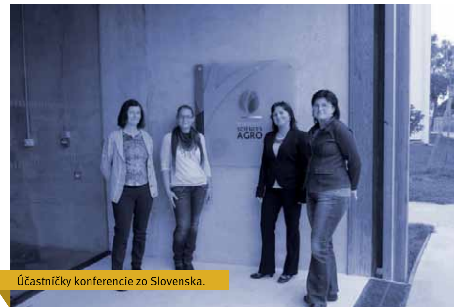
Účastníčky konferencie zo Slovenska.

PF KU je od roku 2014 zapojená do projektu COST Zosúladovanie prístupov pre analýzu politík súvisiacich s lesníctvom v Európe (COST Action FP1207 – Orchestrating forest-related policy analysis in Europe (ORCHESTRA)).