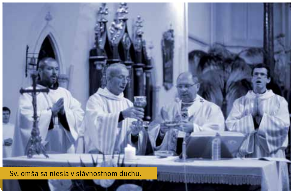
Sv. omša sa niesla v slávnostnom duchu.