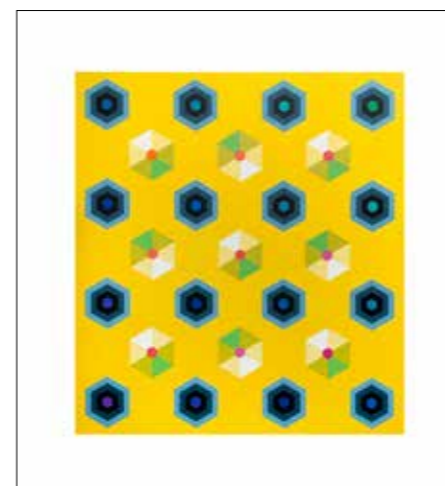
Pavol Rusko: Radostná optika, akryl, 180x165 cm, 2020

? Na Katolíckej univerzite v Ružomberku pôsobíte prakticky od jej založenia. Máte možnosť sledovať dlhodobý rozvoj tejto vzdelávacej inštitúcie. V čom vidíte dnes jej poslanie a jedinečnosť?