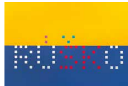
Pavol Rusko: Rúško, akryl, 100x150 cm, 2020