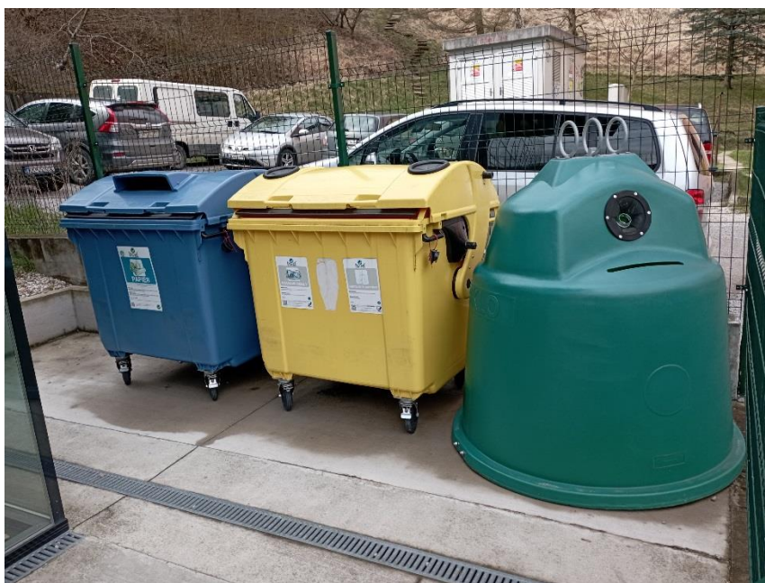
Veľkokapacitné nádoby na separovaný odpad