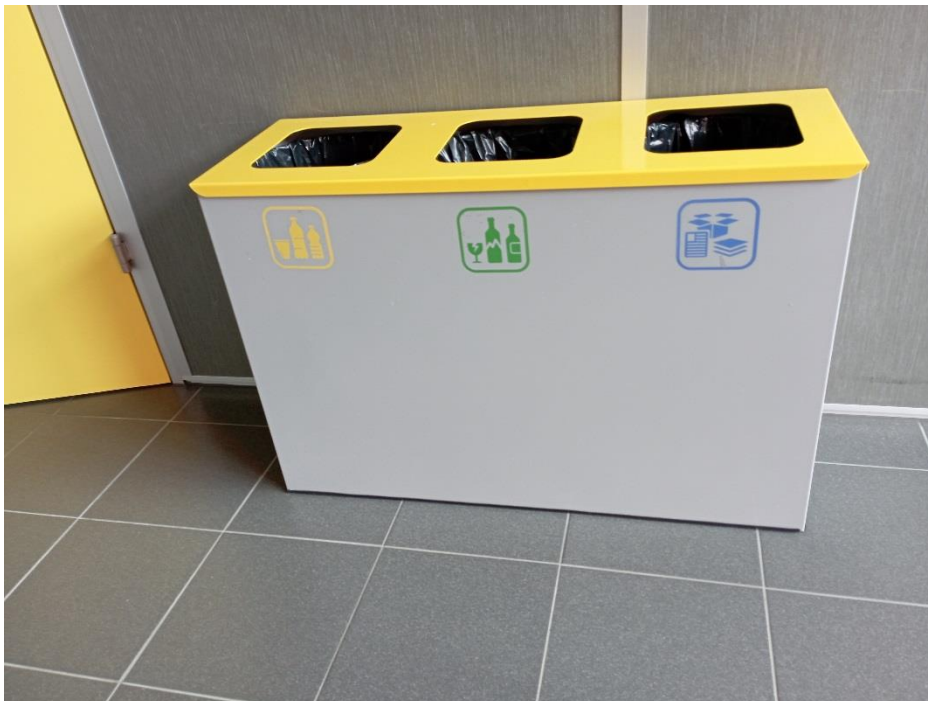
Interiérové smetné koše na triedený odpad