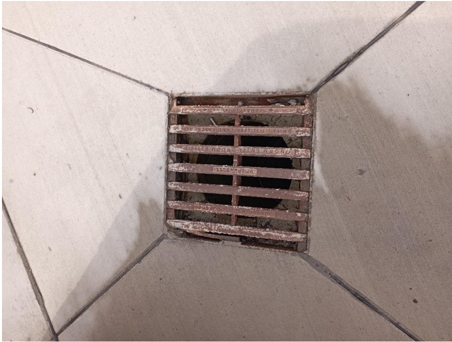
Trativod povrchových vôd (podrobne zakreslené v stavebnom projekte)