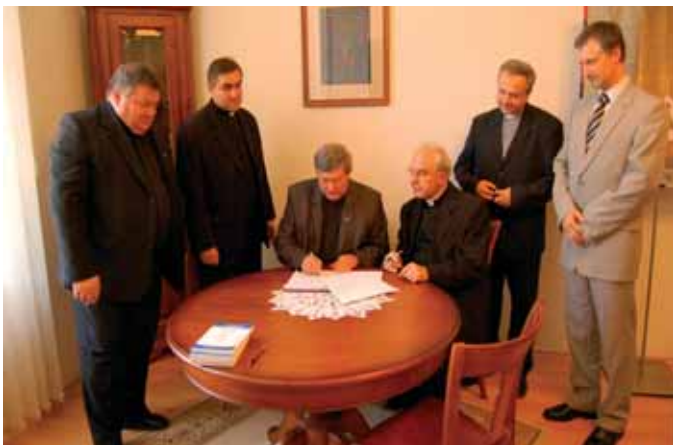
Zástupcovia UKSW podpisujú rámcovú zmluvu o spolupráci s KU.