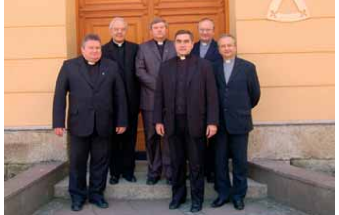
Účastníci návštevy na spoločnej snímke s rektorom.

V priateľskom rozhovore načrtli možnosti spolupráce oboch univerzít najmä vo vede, vo výskume a vo vzájomných akademických mobilitách. Zástupcovia UKSW vysoko ocenili skutočnosť, že KU má v oblasti sociálnej práce priznané prá-