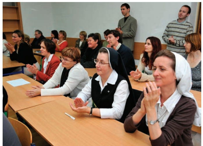
Pedagógovia a zamestnanci z Pedagogickej fakulty KU na stretnutí s vedením univerzity.

Rektor zároveň udelil cenu najlepším vedcom univerzity spomedzi profesorov, docentov a odborných asistentov. Ocenenia odovzdal na návrh fakúlt KU a tento rok si odnášajú cenu 12 vedecko-pedagogických pracovníkov univerzity.