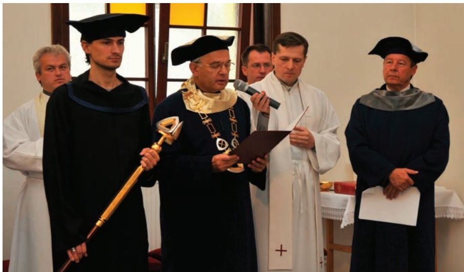
Slávnostný inauguračný sľub nového rektora KU.

Katolícka univerzita v Ružomberku (KU) vznikla v roku 2000, pri vzniku mala dve fakulty – pedagogickú a filozofickú.