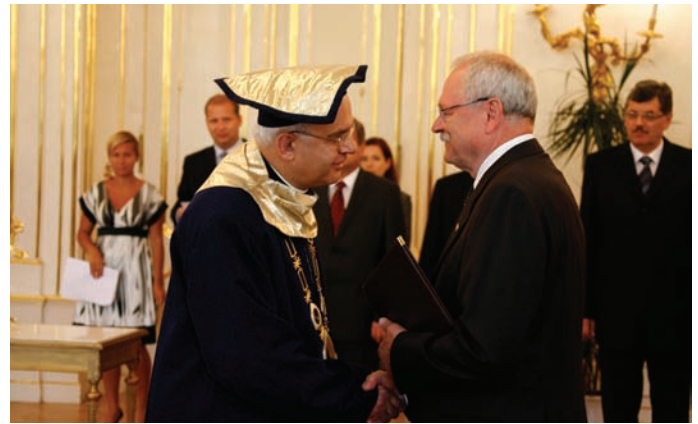
Prezident SR Ivan Gašparovič blahoželá novému rektorovi KU k vymenovaniu.