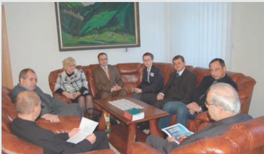
Zástupcovia ministerstva školstva Poľskej republiky tlmochli rektorovi univerzity pozdrav od ministerky školstva Poľskej republiky a vyjadrenie vďaky za doterajšiu spoluprácu.