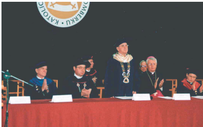
Slávnostná imatrikulácia Otvorenie akademického roka 20.9.2004 na PF KU