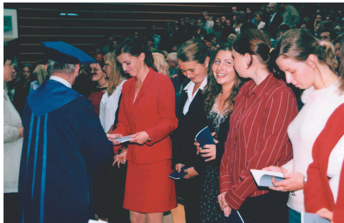
Slávnostná imatrikulácia Otvorenie akademického roka 21.9.2004 na FF KU