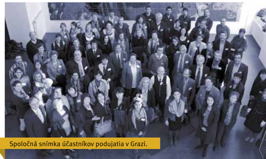
Spoločná snímka účastníkov podujatia v Grazi.

Tento rok v rámci 11. ročníka pricestovalo na KPH 40 vyučujúcich zo 16 európskych