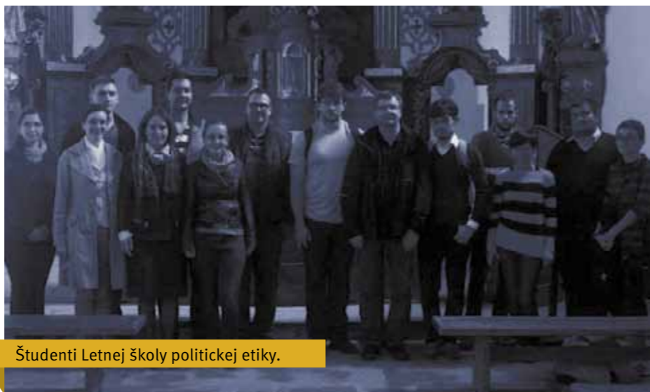
Študenti Letnej školy politickej etiky.