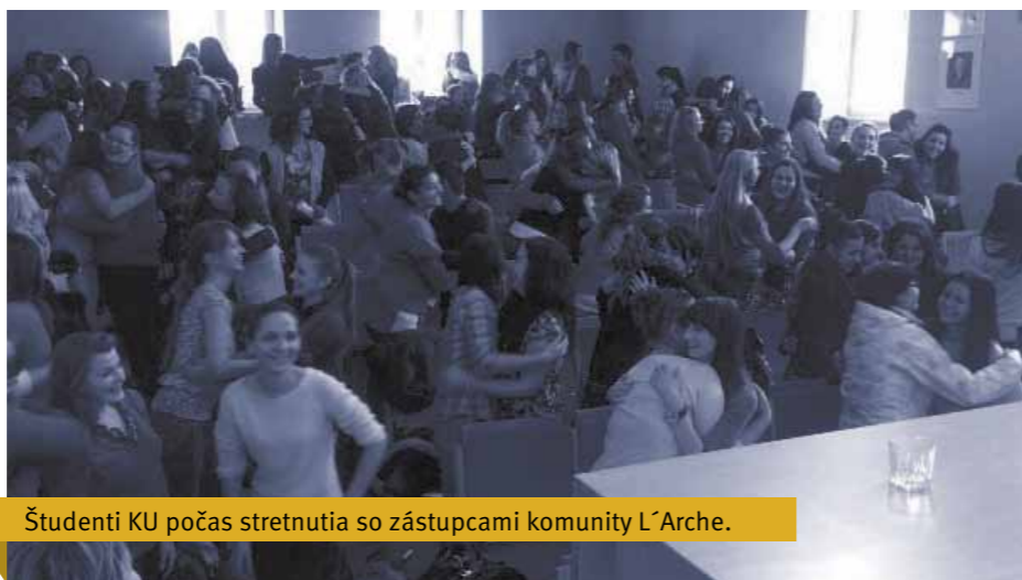
Študenti KU počas stretnutia so zástupcami komunity L'Arche.

Spolupráca L'Arche a Katolíckej univerzity v Ružomberku sa začala v roku 2006, keď KU navštívili prvýkrát predstavitelia L'Arche zo Škótska. Projekt L'Arche, ktorý má vo svete 140 komunít v 39 krajinách, poskytuje domov mentálne postihnutým ľuďom, ktorým pomáhajú svojou asistenciou pri každodenných činnostiach asistenti – dobrovoľníci pri začleňovaní sa do spoločnosti. Od roku 2006 v L'Arche pracovali a pracujú ako dobrovoľníci viacerí študenti z PF KU,