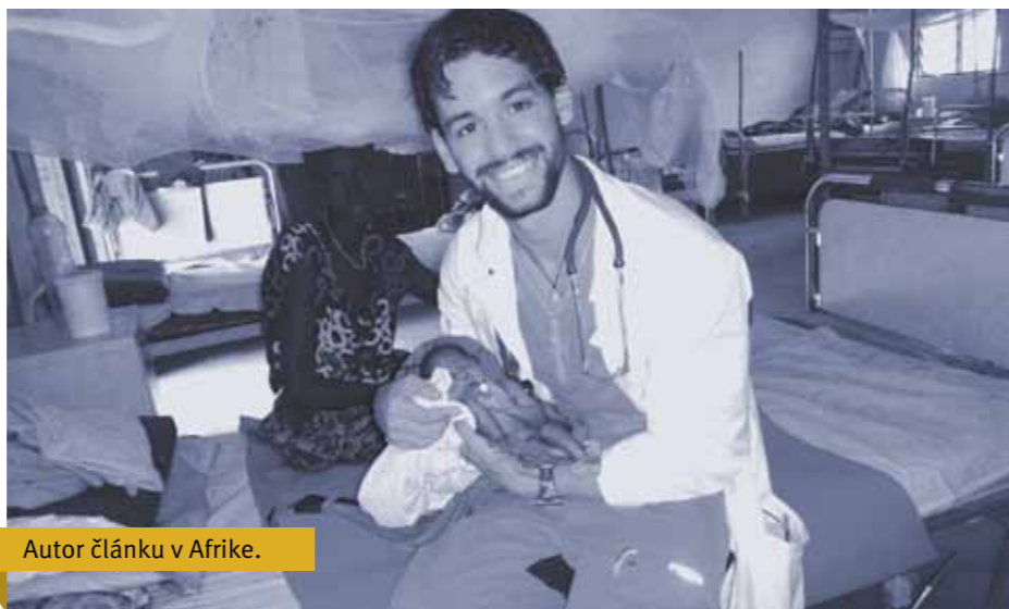
Autor článku v Afrike.

Ako čerstvý absolvent urgentnej zdravotnej starostlivosti FZ KU v Ružomberku a po ukončení prvom ročníku medicíny, vydal som sa na ďalekú cestu, možno aj za dobrodružstvom, do Južného Sudánu, do tisícky kilometrov vzdalenej nemocnice Mary Immaculate DOR v Mapuordite, v srdci Afriky. Mal som určité predstavy o práci v nemocnici v tak biednej časti sveta a vo veľmi chudobných podmienkach, aké tam sú, ale to, čo som zažil, ma dostalo. Strávil som tam necelé 3 mesiace. Okolo nás bol len buš a mnoho dediniek z hlinených a slamených domčekov (tukuly). Ľudia tu žijú veľmi jednoduchým spôsobom života a majú mnoho detí.