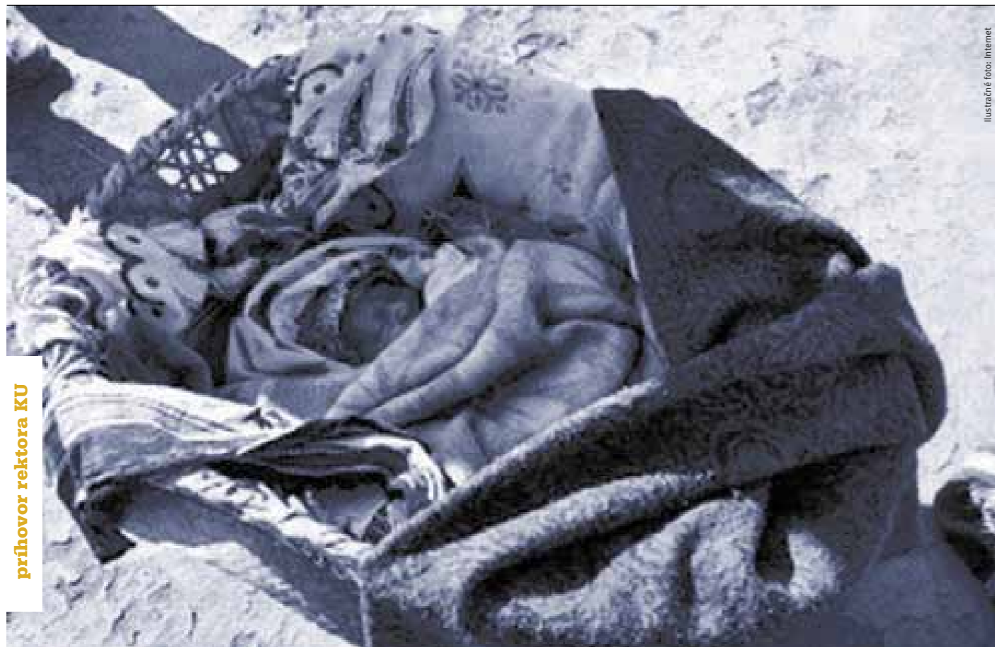
príhovor rektora KU