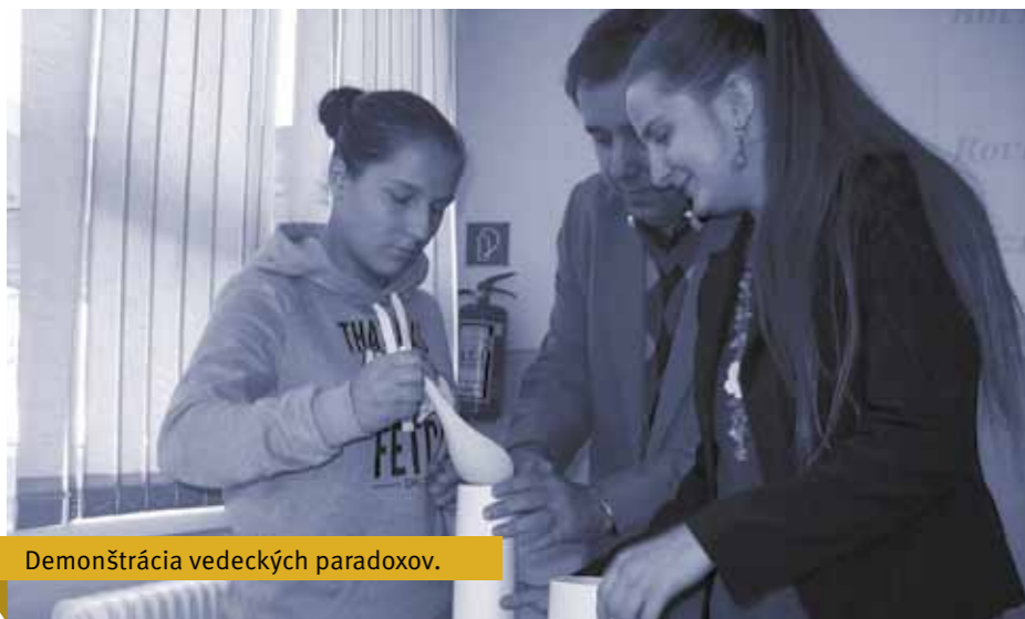
Demonštrácia vedeckých paradoxov.