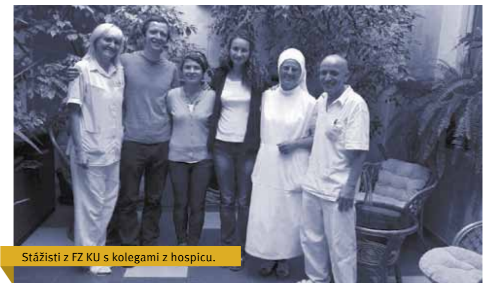
Stážisti z FZ KU s kolegami z hospicu.