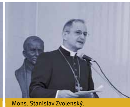
Mons. Stanislav Zvolenský.