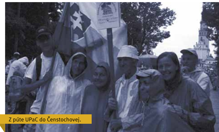
Z púte UPaC do Čenstochovej.

Vchádzame cez bránu nového akademického roka 2014/2015, v ktorom Vám chcem odovzdať srdečný pozdrav a popriať chuť do štúdia, čas na dobrých priateľov a ochotu podeliť sa so svojimi talentami.