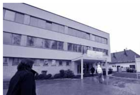
Nová budova Fakulty zdravotníctva KU.

Keď sa s nimi stretávam, vždy sa pýtam, ako sa majú, z čoho sa tešia a čo ich trápi. Ďalším ukazovateľom sú prieskumy, ktoré realizujeme buď my na univerzite alebo nezávislé agentúry. Z výsledkov anonym-