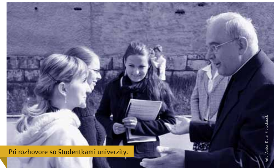
Pri rozhovore so študentkami univerzity.

Nepodarilo sa nám ho celkom uskutočniť najmä preto, že väčšiu časť funkčného obdobia sme pracovali na statusu univerzitnej vysokej školy, ktorý minister školstva potvrdil po odporúčaní Akreditačnej komisie až 18. apríla 2011. Dovtedy nemalo zmysel zaoberať sa vznikom nových fakúlt, no koncom roka 2011 sme požiadali o akreditáciu