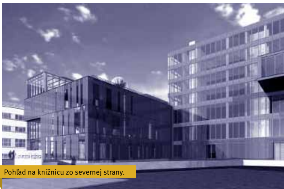
Pohľad na knižnicu zo severnej strany.

V novej knižnici nájdeme aj druhé Rusko umelecké dielo s názvom Otče náš (5x12m) – plotrovaný text osadený na farebných plexisklách, ktoré bude umiestnené oproti vstupu do budovy na prvých troch podlažiach. Pre úplnosť dodajme, že štúdiu a následne projekt interiéru UK KU spracoval Ing. arch. Stanislav Šutvaj. Podrobné informácie o projekte i postupe výstavby nájdete na webe kniznica.ku.sk.