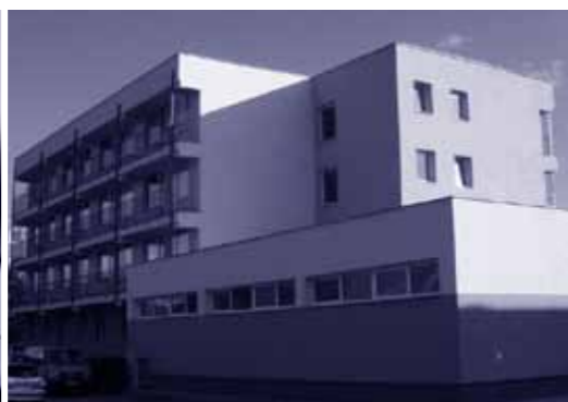
Budova ŠD Ruža po rekonštrukcii.