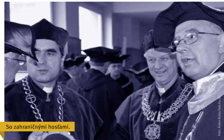
So zahraničnými hosťami.

ra 2012 na Nedefu Katolíckej univerzity v kostoloch, ste spomínali prorocké úlohy univerzity v spoločnosti. Aké je teda postavenie univerzity vo vzťahu ku Katolíckej cirkvi či k zriaďovateľovi Konferencii biskupov Slovenska? Záleží nám na tom, aby bola Katolícka univerzita vnímaná biskupmi, kňazmi i veriacimi ako potrebná a prospešná inštitúcia. Teším sa z každého záujmu otcov biskupov o univerzitu. Pravidelne ich navštevujem a informujem o našej činnosti. Ovocím vzájomnej spolupráce, prejavom dôvery a veľkorysosti bolo zavedenie Nedele Katolíckej univerzity. Biskupi v pastierskom liste z roku 2010 vyjadrili nádej, aby sa v tento deň veriaci na Slovensku modlili za svoju jedinou Katolícku univerzitu. Vo farnostiach sa v deň venovaný univerzite môže čítať list rektora, môžu sa organizovať Kluby priateľov KU... V roku 2012 sa zároveň uskutočnila už tretia zbierka na podporu Katolíckej univerzity, ktorej výťažok opäť využijeme na výstavbu novej univerzitnej knižnice.