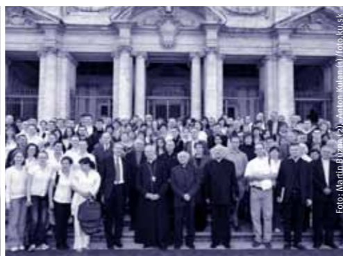
Ďakovná púť KU v Ríme.