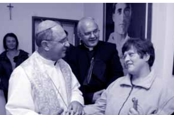
Otvorenie Poradenského centra KU.