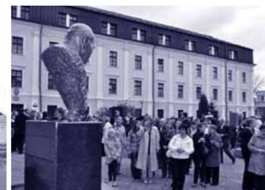
Otvorenie Parku Jána Pavla II.