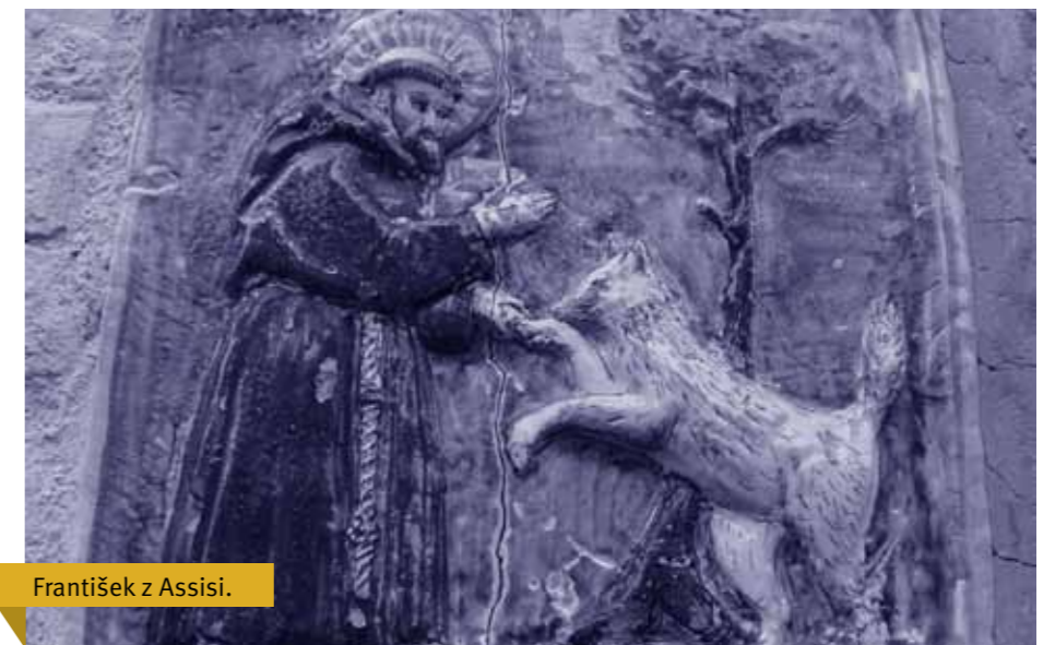
František z Assisi.