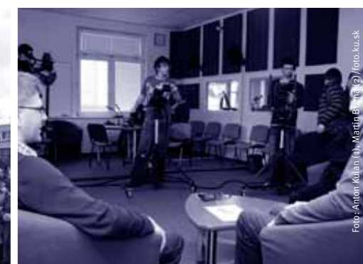
Univerzitné TV štúdio.