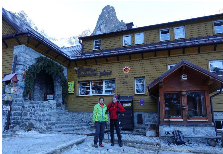
S manželom na Brnčálke, 2015