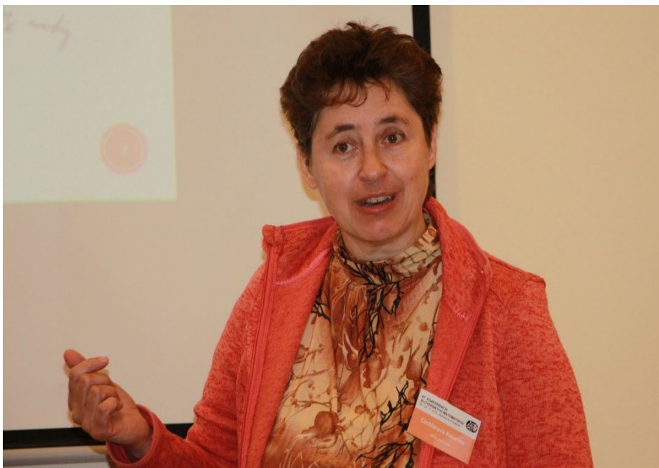
Prednáška na konferencii slovenských matematikov v Jasnej, 2015