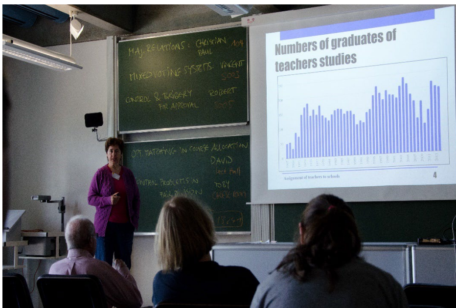
Prednáška o priradovaní študentov učiteľstva na praxe, Dahstuhl seminár, 2015