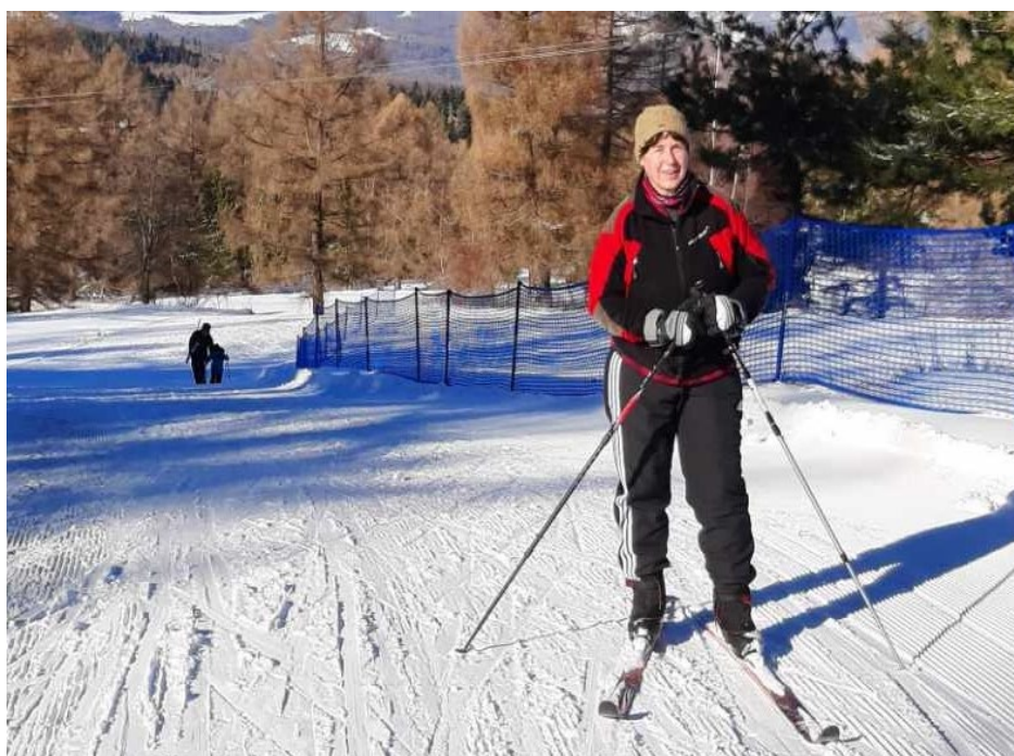
Bežkovanie v Ulož, 2022