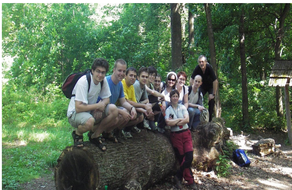
Matematický výlet, 2009