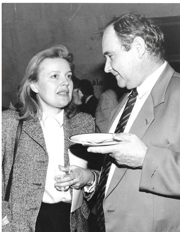
Verejné angažovanie, 1997