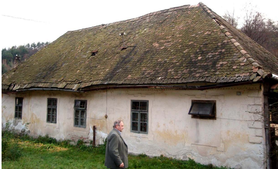
Rozpadávajúci sa rodný dom v Podkriváni