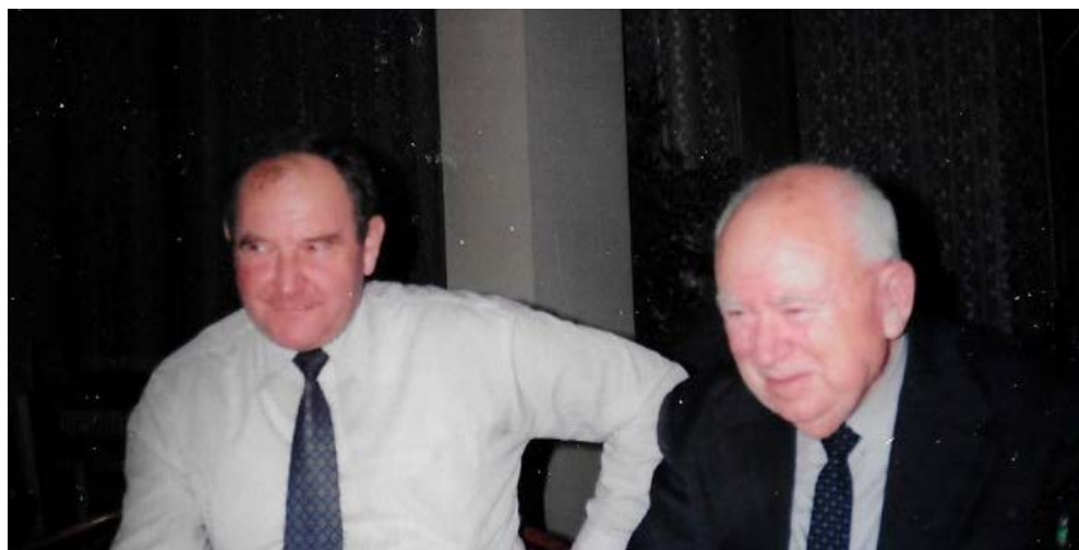
S Tiborom Šalátom, Konferencia slovenských matematikov, Jasná 2000