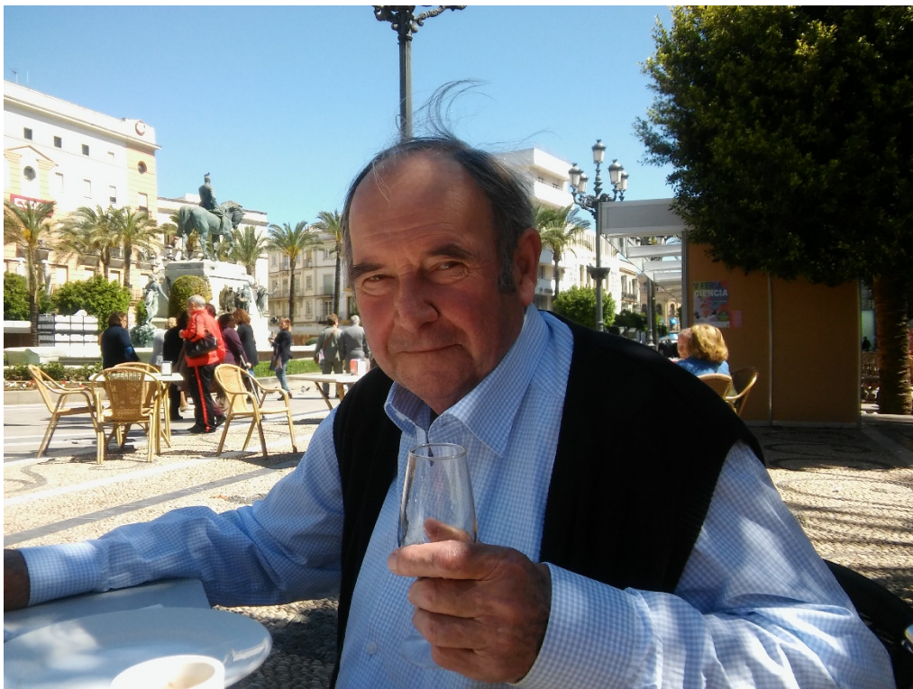
S pohárom sherry v Jerez de la Frontera, 2017