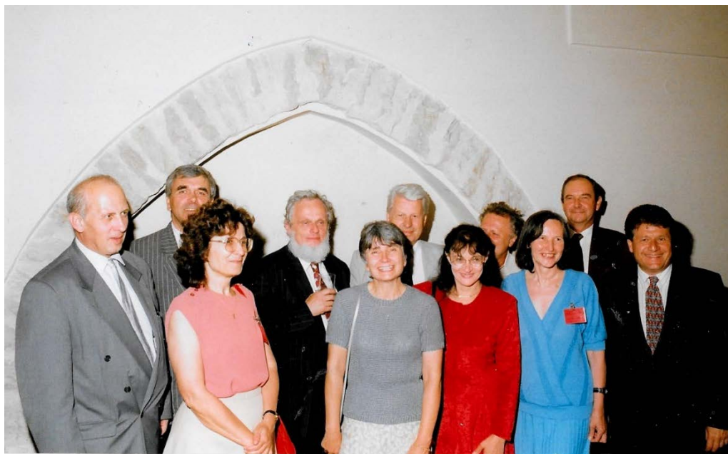
Vopěnkov seminár po 34 rokoch