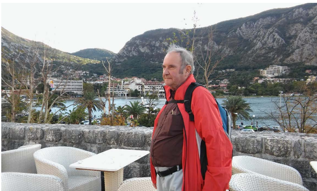
Potulka Balkánom, Kotor, Čierna Hora 2017